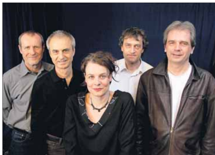
Bringen Blues immer wieder neu zum Klingen: Black Cat Bone aus Tübingen